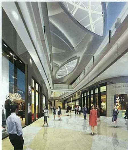
Taubman Asia 有分投資的澳門 高級購物商場 「星麗門」